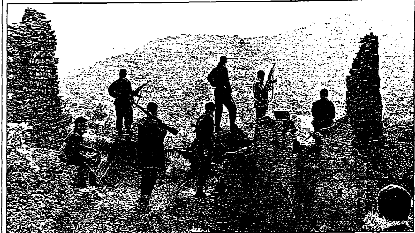
دوشتيون برابون جبال منطقة القبائل التي ينشط فيها الأمير حسن خطاب